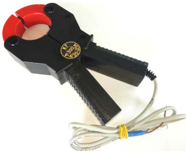
Рисунок 4 – Общий вид клещей токоизмерительных КТ-***-У-4/20-Д54