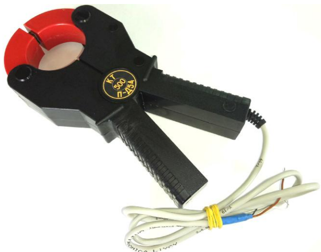
Рисунок 5 – Общий вид клещей токоизмерительных КТ-***-П-Д54