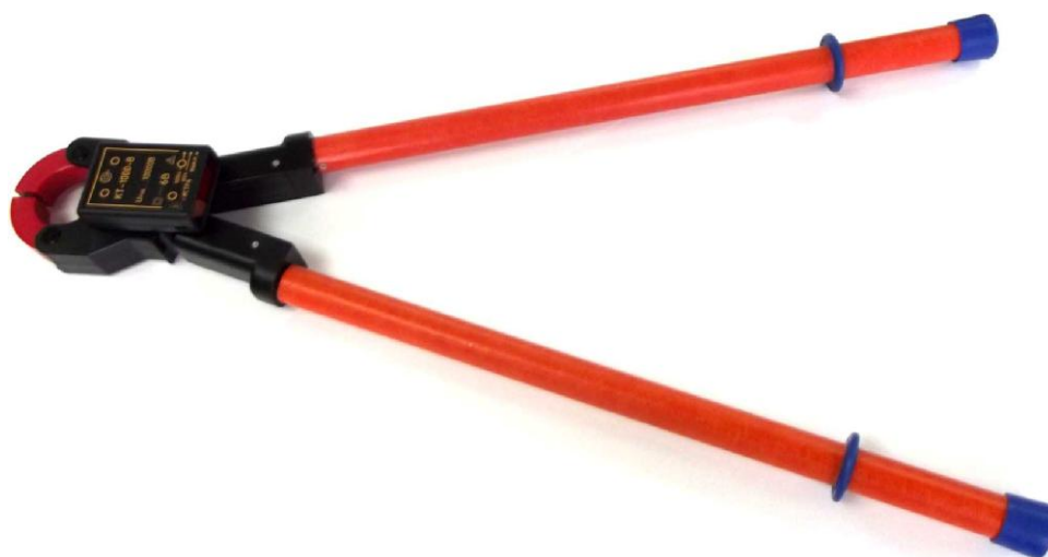
Рисунок 7 – Общий вид клещей токоизмерительных КТ-1000-В (с ручками)