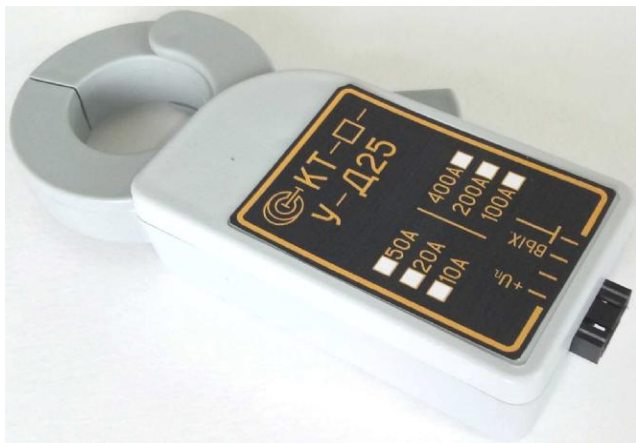
Рисунок 1 – Общий вид клещей токоизмерительных КТ-***-У-Д25

Дополнительно в обозначении клещей присутствуют следующие буквы и цифры: Д – обозначает диаметр входной токовой шины; цифры 25 и 54 после буквы Д – обозначают размер отверстия магнитопровода клещей под входную токовую шину в миллиметрах (диаметр). Общий вид клещей представлен на рисунках 1 – 8. Пломбирование клещей токоизмерительных КТ не предусмотрено.