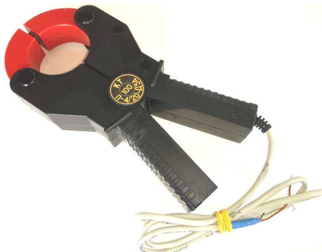
Рисунок 6 – Общий вид клещей токоизмерительных КТ-***-П-4/20-Д54