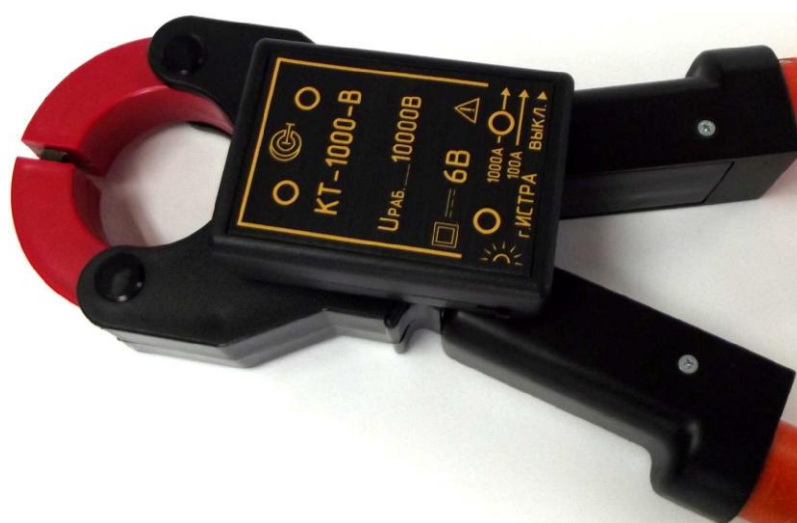
Рисунок 8 – Общий вид клещей токоизмерительных КТ-1000-В (без ручек)