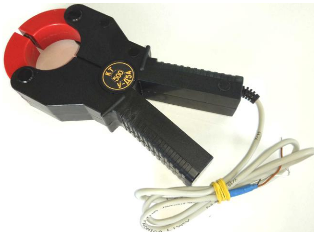
Рисунок 2 – Общий вид клещей токоизмерительных КТ-***-У-Д54